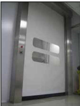
Ταχυκίνητη πόρτα clean room Fast roll clean room door Portes rapide rouleau chambre propre

Τηλεχειρισμός Remote control Télécommande