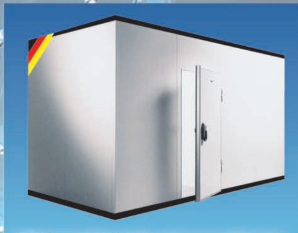
Θάλαμοι σε όλες τις διαστάσεις για κάθε χώρο.