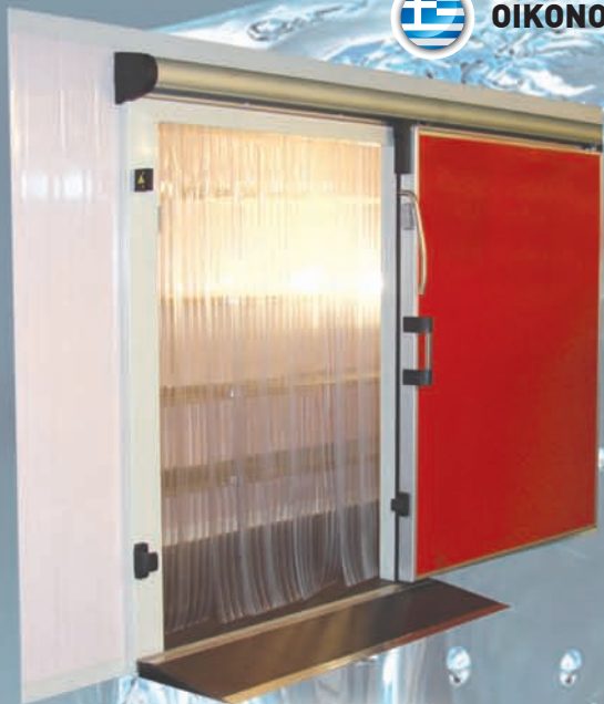
Θάλαμος με συρόμενη πόρτα και κουρτίνα.