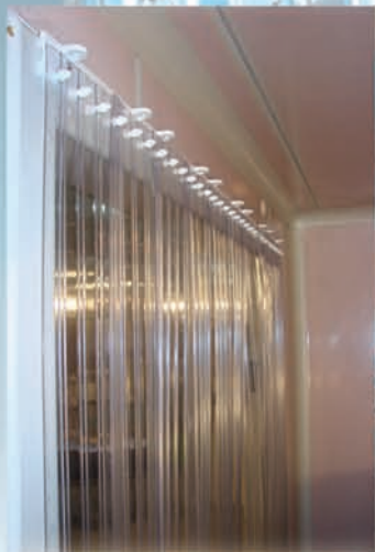
Κουρτίνα από το εσωτερικό του θαλάμου.