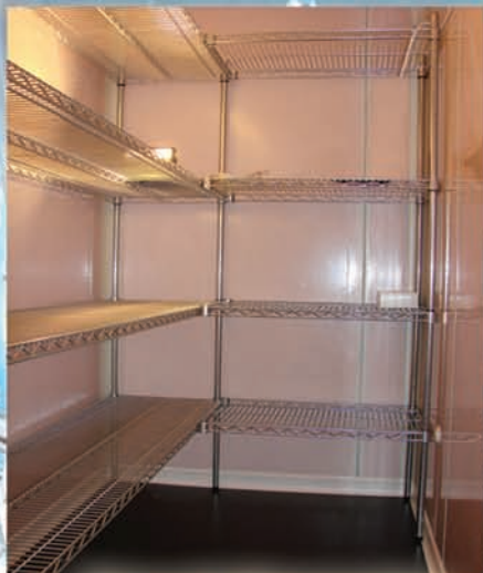
Ράφια ρυθμιζόμενα σε ύψος μέσα σε θάλαμο.