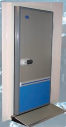
Δίχρωμη πόρτα με ράμπα.