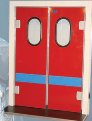
Δίφυλλη πόρτα πολυαιθυλενίου φλιπ-φλαπ.