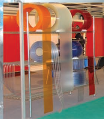
Χρωματιστές και διαφανείς κουρτίνες.